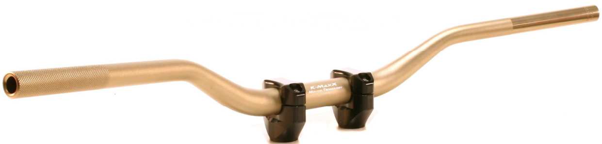
C32-CR in titan mit schwarzen Klemmböcken