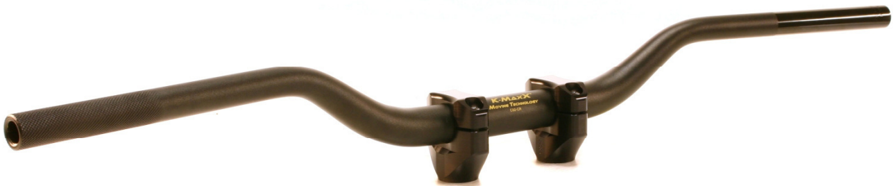
C32-CR in schwarz mit schwarzen Klemmböcken